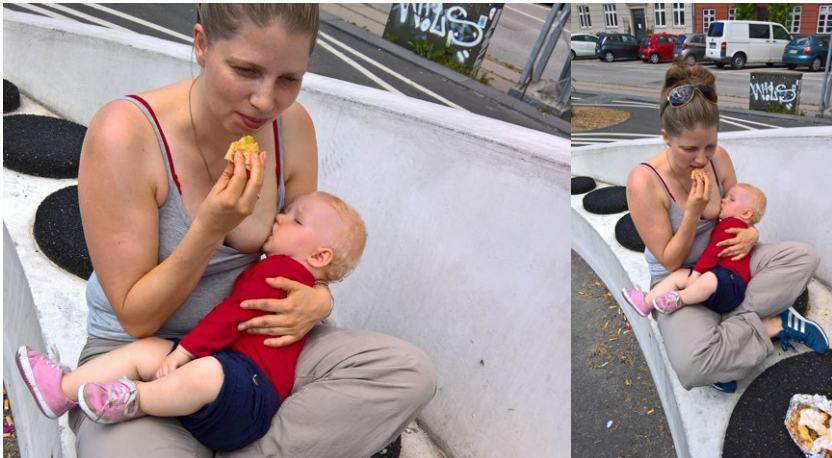
Mor og barn spiser frokost

Som beskrevet tidligere er flavour en kombination af de forskellige sanseindtryk, vi får, når vi spiser. Den smag, vi oplever, afhænger således kraftigt af signaler fra lugtesansen.