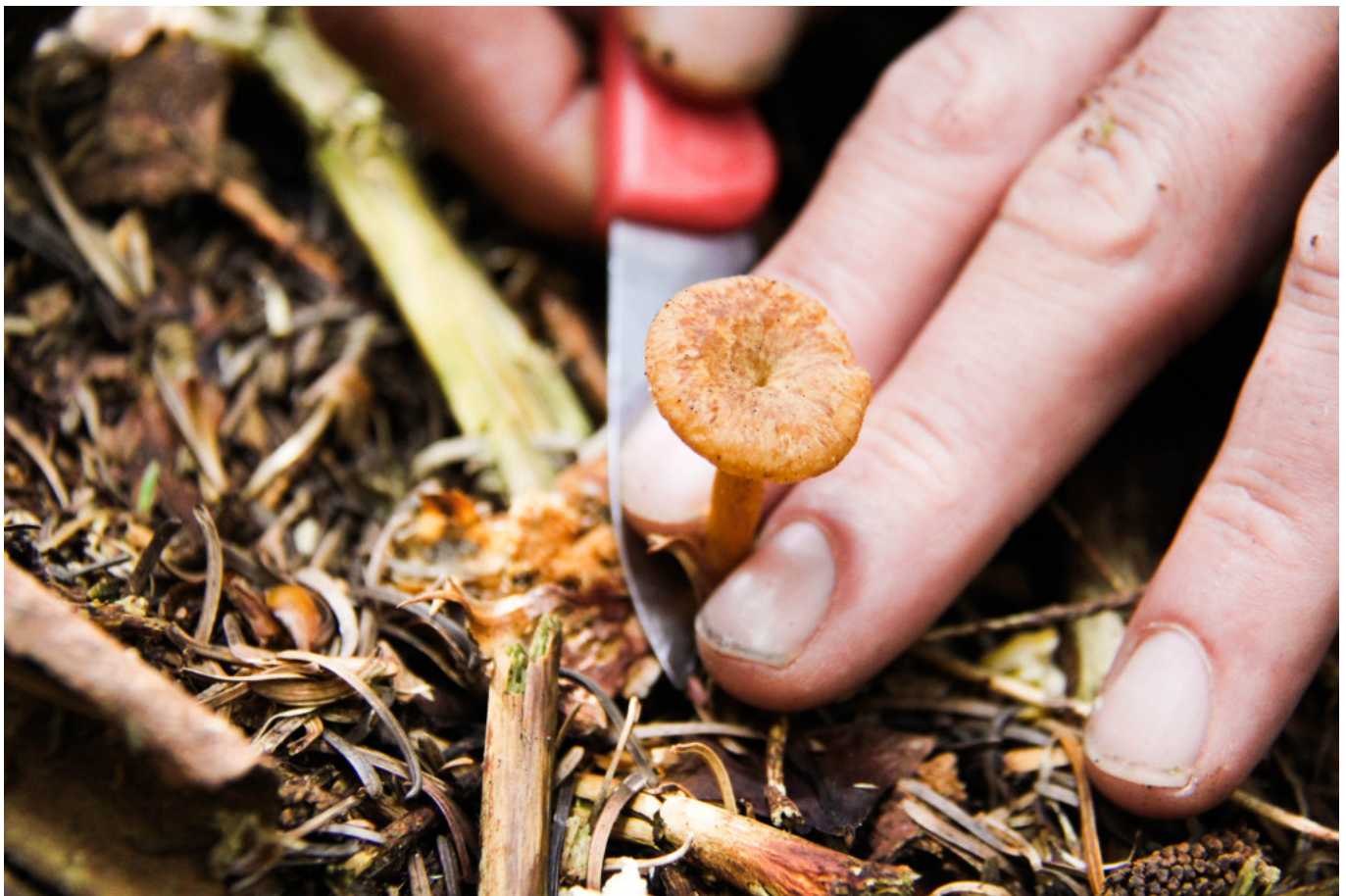
På sanketur i skoven.