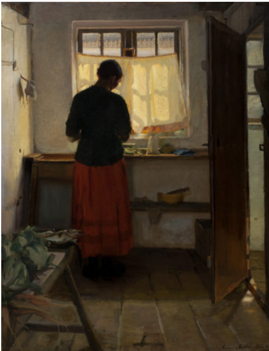
Anna Ancher: Pigen i køkkenet 1883-86 (Den Hirschsprungske Samling)

Anna Ancher "Pigen i køkkenet" kan bruges til at komme i gang med billedanalysen. Lad nysgerrigheden og lysten til at vide mere om billedet være elevernes drivkraft og motivation eller tag udgangspunkt i følgende spørgsmål, som kan bruges som optakt til en faglig snak i klasselokalet: