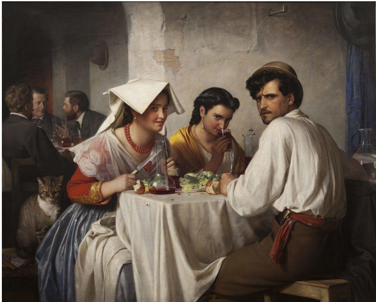
Carl Bloch "Fra et romersk osteria" 1866 (SMK)

Kig godt og længe på billedet. Start evt. i det ene hjørne og bevæg dig gennem billedet. Brug gerne de værktøjer, du har lært i de foregående aktiviteter.