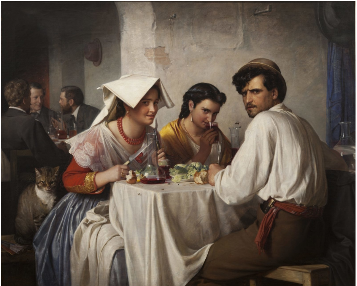
Carl Bloch " Fra et romersk osteria" 1866