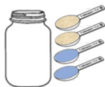
1. Mix flour and water.