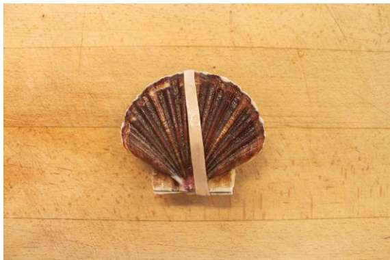
1. Kammuslingen leveres med elastik omkring for at undgå udtørring