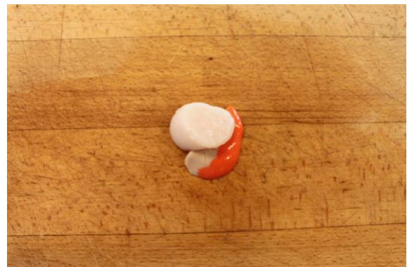
7. Fjerne mavesæk, gæller, indvolde og lukkemuskel med en kniv og fingre, og skyl muslingen i iskoldt vand