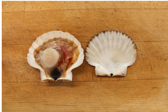
4. Del skallerne fra hinanden med fingrene