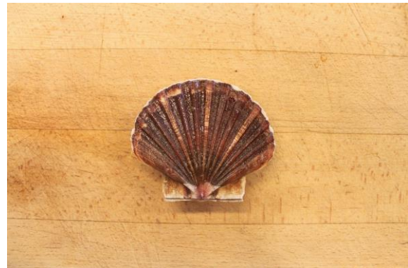
2. Fjern elastikken