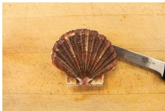
3. Åben skallen lidt med fingre eller kniv og skær svømmemusklen fri fra den flade skal