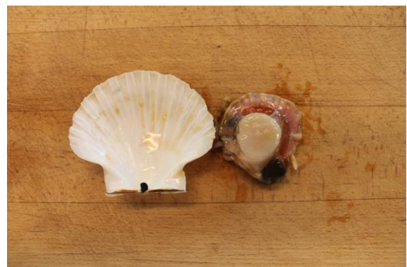
5. Befri muslingen (ved lukkemusklen) med en kniv eller ske