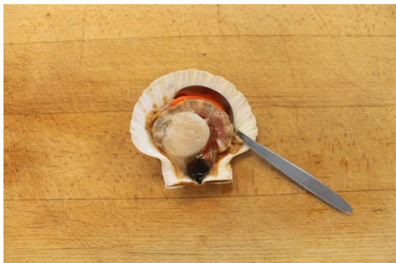
6. Tag muslingen ud af skallen. Skallerne kan koges i saltet vand og bruges til at anrette i