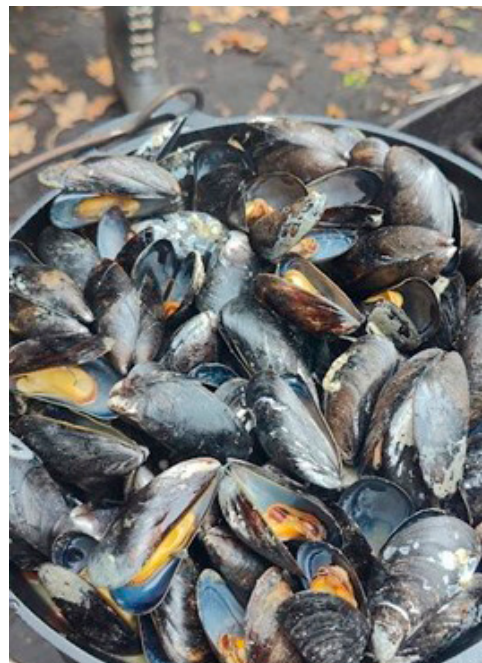
Blåmuslinger dampet over bål