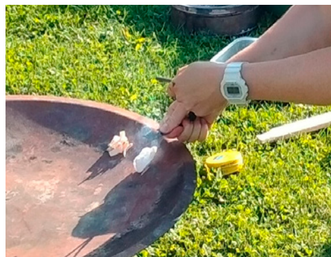
Optænding med vat dyppet i vaseline antændt med tændstål