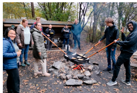
Pandestegning over bål

Denne aktivitet kan kombineres med det særlige fokus om fagidentitet, hvor eleverne kan bruge tid på at diskutere, hvordan håndværket har forandret sig gennem tiden, og hvilke teknologiske løsninger der har hjulpet med nogle af de udfordringer de oplever under tilberedningen over bål.