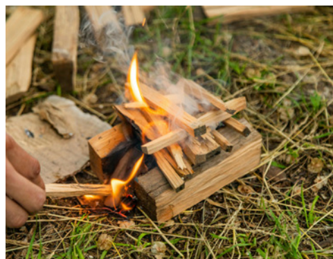
Starten på et pagodebål