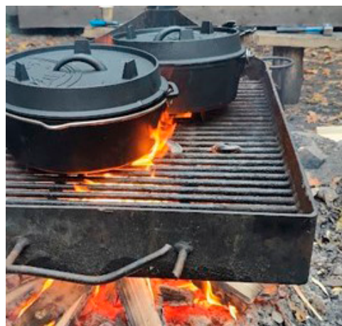
Dutch ovens på grill over bål