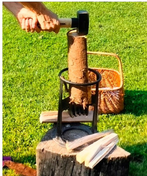
Kindling Cracker i brug med mukkert