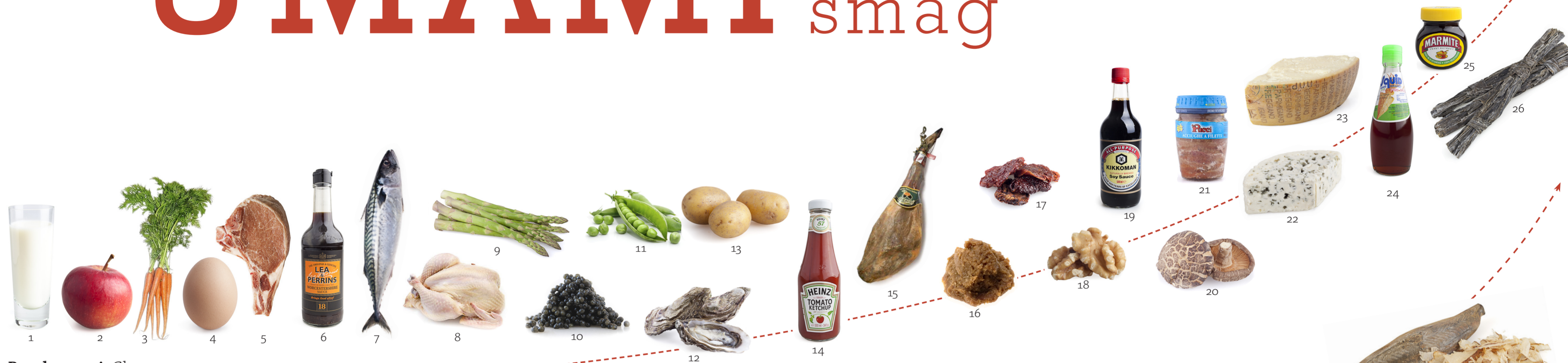
Basal umami. Glutamat